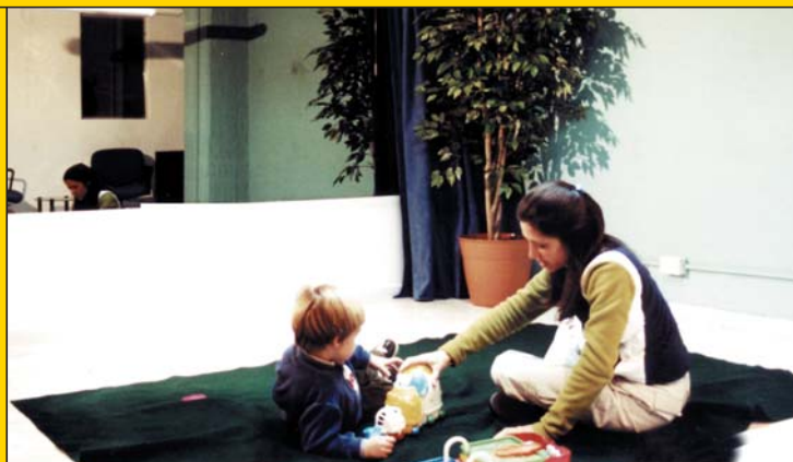
Práctica en la Cámara Gessell de la UP