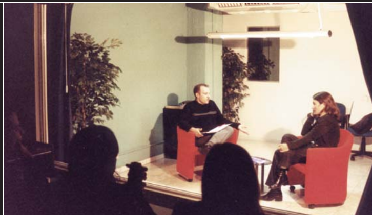
Práctica en la Cámara Gessell de la UP

A partir del 2do. cuatrimestre del 2do. año los alumnos realizan prácticas profesionales que les permiten integrar y aplicar los conocimientos. Estas Prácticas podrán incluir: