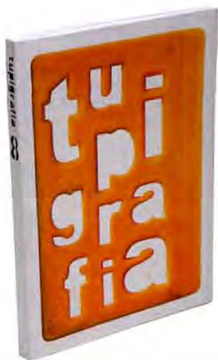
+ Tipografía (tapa de revista), 2008. Dirección de arte: Felipe Taborda. Diseño: Lygia Santiago.