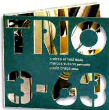
• CD Trio (re), album packaging, 2009. Dirección de arte: Felipe Taborda. Diseño: Lygia Santiago.