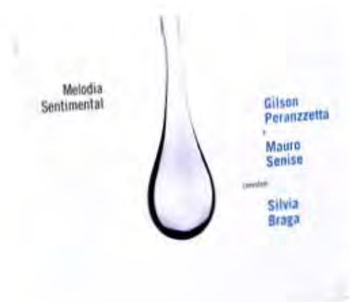
• Melodia Sentimental, album packaging, 2009. Dirección de arte: Felipe Taborda. Diseño: Lygia Santiago.