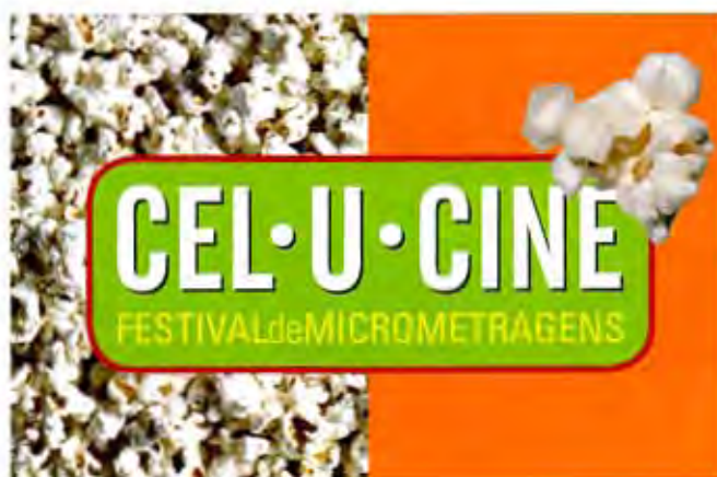
• Cel·U·Cine logo, 2009. Dirección de arte: Felipe Taborda. Diseño: Lygia Santiago.

“...y más proyectos propios, más ligados a lo cultural”.