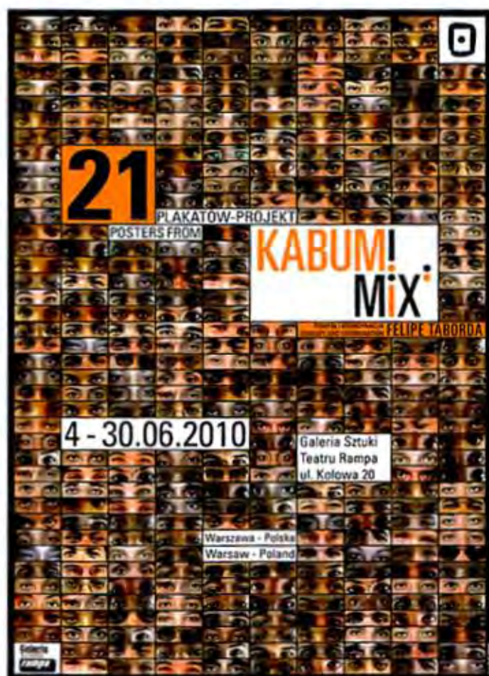
• Plakat Kabum!, 2010. Dirección de arte: Felipe Taborda. Diseño: Lygia Santiago.