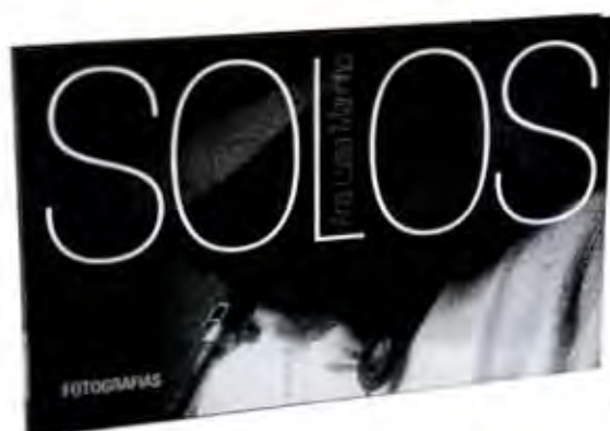
• SOLOS, FMP. Dirección de arte: Felipe Taborda. Diseño: Lygia Santiago. Foto: Luisa Mármora.