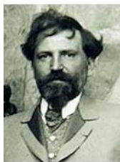
Alfons Maria Mucha

El pintor y cartelista checo, Alfons Musha es reconocido como uno de los máximos exponentes del Art Nouveau. Son de destacar también los trabajos de Eugène Grasset , cartelista e ilustrador suizo y del artista austriaco Koloman Moser , quien realizó una relevante obra en las creaciones gráficas de principios del siglo XX.