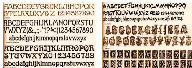
Tipografía Art Nouveau

Destacados maestros tipógrafos de este período son: Morris Fuller , William Morris , Stanley Morison , Paul Renner , Eric Gill , Bruce Rogers , Hans Mardersteig y Jan Van Krimpen .