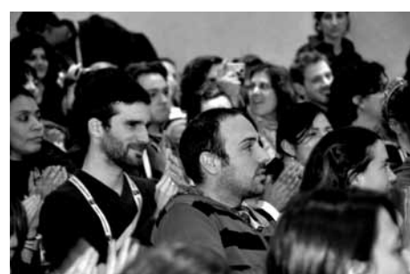
Cierre del Encuentro Latinoamericano

El Encuentro Latinoamericano de Diseño 2010 se desarrolló simultáneamente en 3 sedes. Más de 300 actividades se realizaron en las modalidades de conferencias o talleres, sobre las temáticas actuales del diseño: negocios, creatividad, tecnología, ecodiseño y tendencias, entre otras.