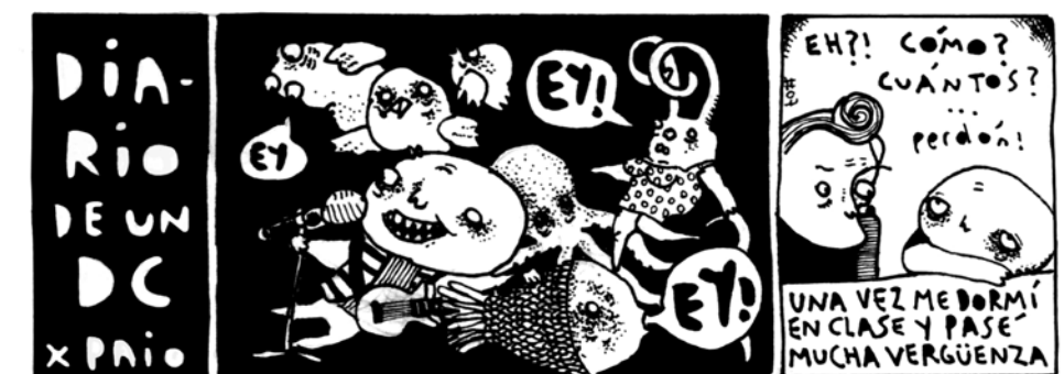
Paio Zuloaga (Diseño Gráfico DC) www.paiozuloaga.blogspot.com

Inscripción previa: generaciondc1@gmail.com . Actividad solo para estudiantes y egresados DC-UP.