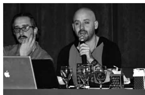
José María Muscari, director, actor y productor de teatro