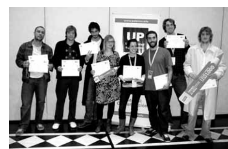
Ganadores de los concursos del Encuentro Latinoamericano de Diseño 2010