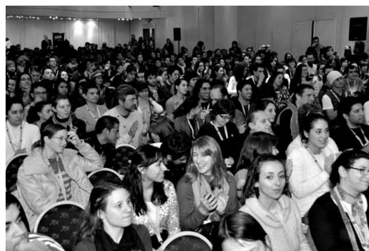
Multitudinario cierre del Encuentro Latinoamericano (izq.). Ganadores del sorteo de productos donados por las empresas participantes en Nestra Feria de Diseño.

Otro espacio inédito de la quinta edición fue el Primer Congreso Latinoamericano de Enseñanza del Diseño, del que participaron más de 300 docentes y académicos de las más destacadas Escuelas de Diseño de América Latina. El Congreso es convocado por el Foro de Escuelas de Diseño, que reúne a más de 200 instituciones educativas de América Latina, España y Portugal. Este primer Congreso se planteó avanzar conceptualmente en dos líneas de desarrollo. Por un lado, actualización de la agenda de temas, en la reflexión compartida sobre problemáticas comunes, en el intercambio de experiencias exitosas y el análisis de casos significativos. Por otro lado, ha sido una oportunidad única de conocimiento institucional y personal, de intercambio de materiales, de establecimiento de contactos y de elaboración de proyectos interinstitucionales. (Ver nota en la próxima edición de Noviembre 2010 de DC)