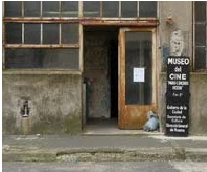
Figura 3: Fachada del Museo del Cine Pablo Ducrós Hicken. (Noviembre 2009).

La imagen que el predio trasmite es realmente vergonzosa, lejos está de presentar medidas de restauración, pero más lejos se encuentra aún de tener un espacio propio para salvaguardar y conservar los elementos que hacen parte del patrimonio audiovisual, además de brindar acceso al público para su consulta. De nada sirve que el museo tenga grandes volúmenes de material audiovisual, si no están debidamente clasificados y catalogados.