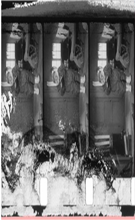
Figura 7: Lesiones producidas por la humedad. Disponible en: Amo García, A. (1996) . Inspección técnica de materiales en el archivo de una filmoteca. Nº 15. Madrid : Ministerio de Cultura, Filmoteca Española. Fuente: http://www.mcu.es/cine/docs/MC/FE/InspeccionTecnica15.pdf

La copia original inflamable de este material resultó gravemente dañada por la humedad que llegó a disolver completamente zonas de la emulsión produciendo manchas transparentes.