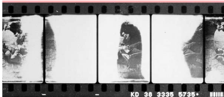
Figura 8: Lesiones producidas por la humedad. Disponible en: Amo García, A. (1996) . Inspección técnica de materiales en el archivo de una filmoteca. Nº 15. Madrid : Ministerio de Cultura, Filmoteca Española.

La copia original inflamable de este material resultó gravemente dañada por la humedad que llegó a disolver completamente zonas de la emulsión produciendo manchas transparentes.