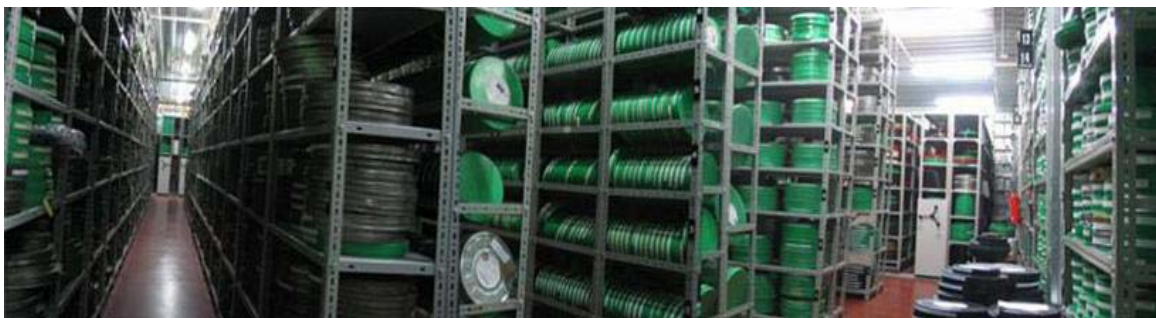
Figura 10 : Filmoteca de Catalunya.

A nivel internacional España es un modelo a seguir. La filmoteca pertenece desde 1956 a la FIAF. La Filmoteca Española dispone de 35.000 títulos, de los que 14.500 son de producción española, y los restantes extranjeros, y conservan 66.000 rollos de películas cinematográficas (en 35mm, 16mm, 8mm y 9,5mm). Ya está en construcción el Centro de Conservación y Restauración de Fondos Fílmicos de la Filmoteca Española y la creación del Centro Nacional de Artes Visuales, que se ubicará también en Madrid y que albergará al Museo del Cine, donde se encontrarán parte de las 23.000 piezas de material fílmico que conserva actualmente la institución. Aquí se aprecia el interior de una de las bóvedas de la filmoteca.