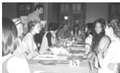
Integrantes del proyecto de Diseño de Indumentaria durante el almuerzo en IL GATTO