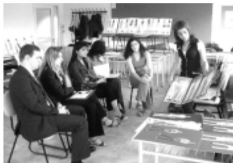
Representantes de IL Gatto en la Facultad durante el proceso de selección de los trabajos presentados