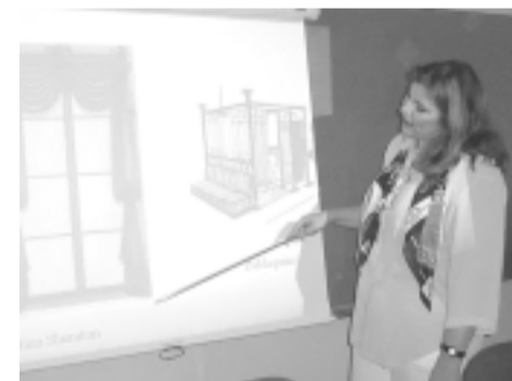
Empresa El Cortinero by DEK y RADOG SRL.

El 2, 16 y 30 de octubre se llevó a cabo el Seminario sobre El dominio de la luz en el Diseño de Interiores, organizado por el sitio BUSCADORDECORACION.COM organizado en tres conferencias dictadas por profesionales de importantes empresas.