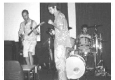
The Renato Experience Band