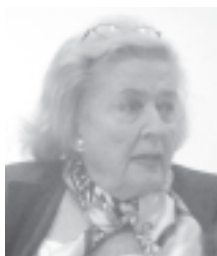
CHINA ZORRILLA Actriz