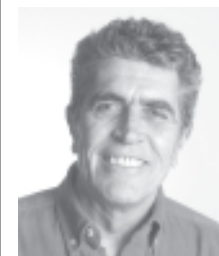
HUGO MIDÓN Actor - Director