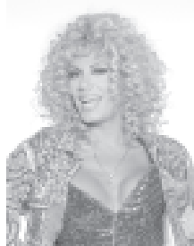
13 de junio, 15 hs. Florencia de la V y Miguel Angel Rodríguez