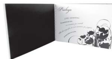
Wilman Castilla (2° premio)