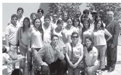
Alumnos y docentes de la Universidad DuocUC (Chile) en nuestra Facultad

Universidad Austral (Chile), Universidad del Bío Bío (Chile), Universidad del Valle del Cauca (Colombia), Universidad DuocUC (Chile), Universidad La Salle (México).