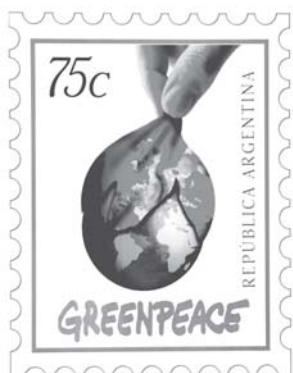
Yamila Chible (3° premio)