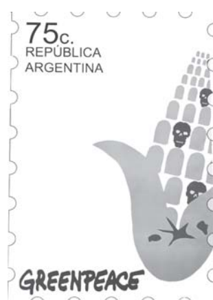
Lucila Giavedoni (1° premio)

Ganadores de los concursos del primer cuatrimestre 2006 en las carreras de la Facultad de Diseño y Comunicación. En las próximas ediciones de DC se publicarán los ganadores de los otros concursos.