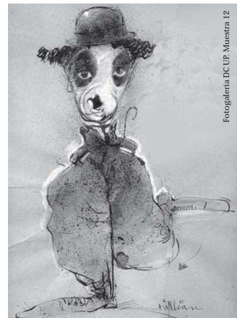
Fotogalería DC UP. Muestra 12

La apertura del Programa Diálogo con Profesionales 2007 es en abril. A partir de este año se suma al Programa la Escuela de Turismo y Hotelería UP.