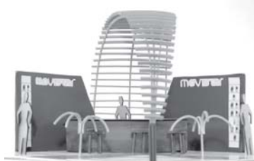
Guido Sassi (1° premio)