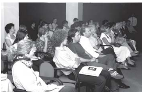
Presentación de la carrera Management Gourmet y posterir Vino de Honor junto a los asistentes interesados en la misma.