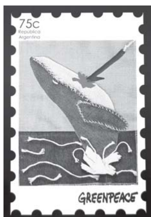
Diego Crescini (2° premio)