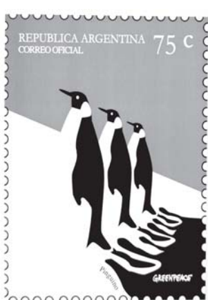
Mauro Rapisardi (2° premio)