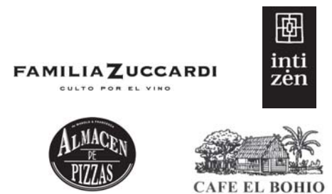
Empresas que agasajaron a los presentes con la experiencia gourmet