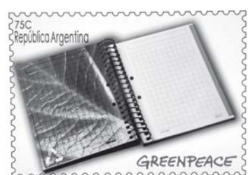
Guadalupe Orfila (3° premio)