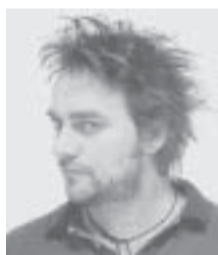
Lunes 2 de mayo Vicentico