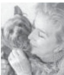
Lunes 9 de mayo China Zorrila