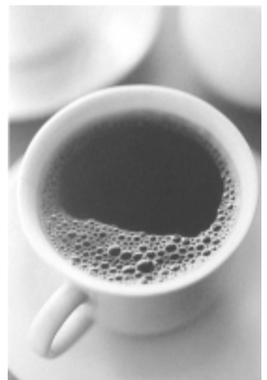
Tercer premio comp. producto: MARCELO WAIN