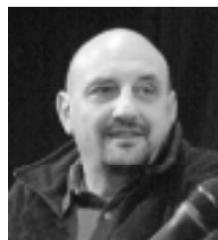
Gabriel Goity. Actor