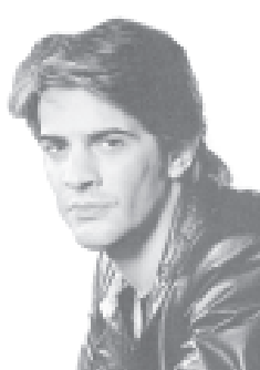
7 de noviembre: PABLO ECHARRÍ