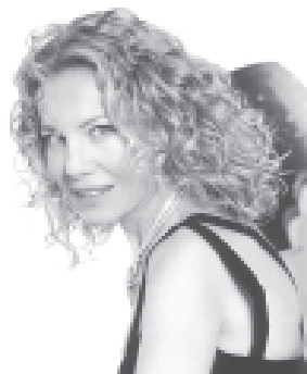
14 de noviembre: CECILIA ROTH

Informes e inscripción: 5199 4500 int. 1502, 1514, 1530. Mail: consultasdc@palermo.edu