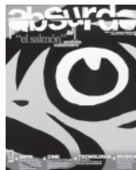
Cultura Jóvenes. Revistas de Cultura. 1º premio comp.: Wilman Castilla Verano

Creaciones de estudiantes premiados en concursos de la Facultad 2006-2 [pág. 6 y 7]