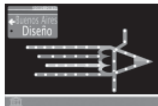
1º premio comp.: Joaquin Olmedo