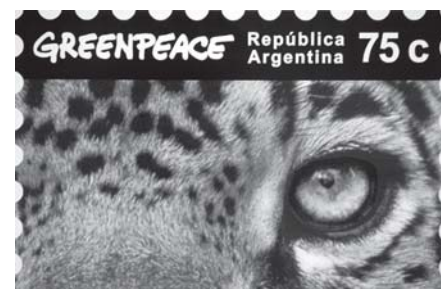
3º premio: G. Ceballos Herklotz

Creaciones de estudiantes premiados en concursos de la Facultad 2006-2 (pág. 6 y 7)