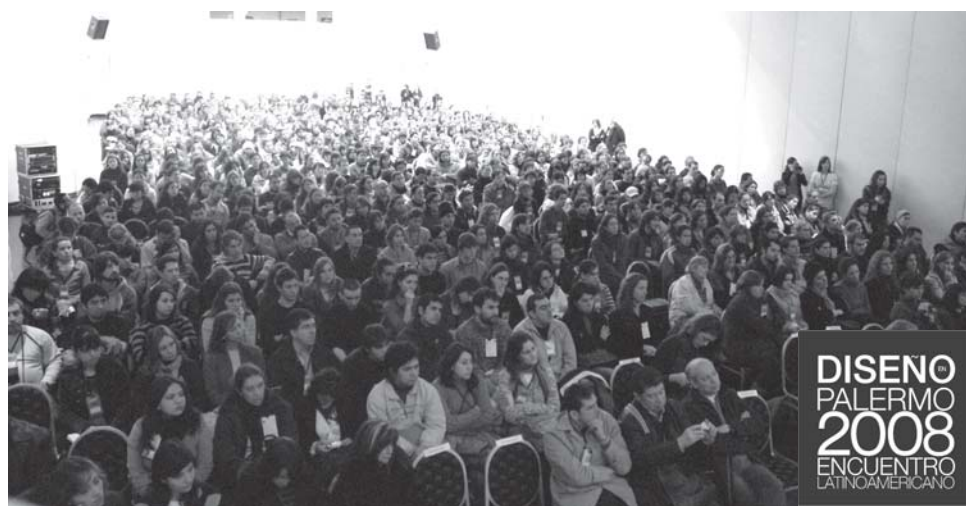
Más de 1000 asistentes al cierre del Encuentro el viernes 3 de agosto