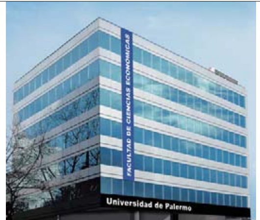
Sede de la Facultad de Ciencias Económicas Av. Santa Fe esq. Larrea 1079

Gracias por considerar estudiar una carrera de negocios en la Universidad de Palermo. Es un placer brindarle una primera introducción a la información que ha requerido.