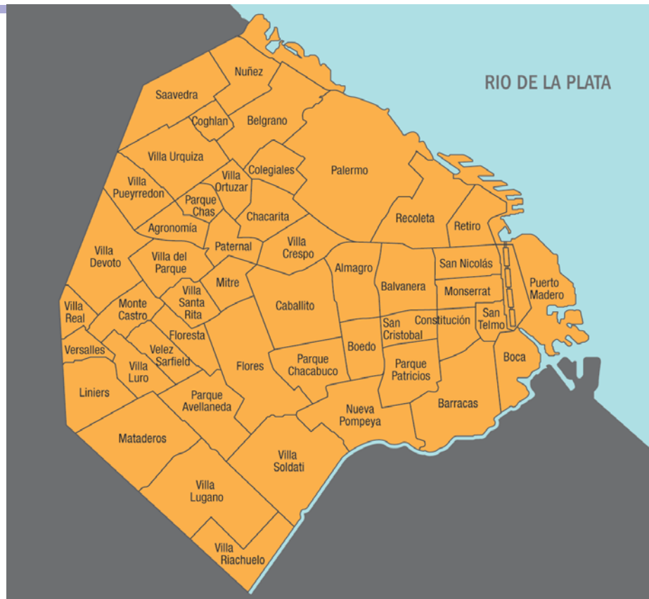
Mapa de barrios ►