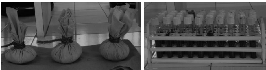
Fig 1. Ceparío Suelo-arena. (a) Sustrato estéril (b) Preparación sustrato-suspensión de esporas

Preservación en Suelo-Arena. Se preparó una mezcla de suelo orgánico y arena malla No. 35 en una relación 1:3 v/v y se esterilizó con vapor a 120°C por dos horas. La mezcla de suelo se dejó al ambiente por 24 horas para permitir la germinación de esporas no eliminadas y se repitió el proceso de esterilización. A las 24 horas se rellenaron con esta mezcla tubos de vidrio de 15 x 100 mm con tapón de rosca a 2/3 partes de capacidad y se esterilizaron con vapor a 120°C por dos horas y se inocularon con suspensión de esporas a partir de cultivos puros. Las suspensiones de esporas se prepararon removiendo el micelio y conidias de la superficie del agar por raspado con una espátula estéril, utilizando agua destilada estéril con Tritón X-100 (0.1% v/v). El volumen de suspensión utilizado fue de 2 ml por tubo inoculado (Windels, Burnes & Kommendahl, 1988). Se siguió el mismo procedimiento para cada microorganismo bajo condiciones de asepsia (Figura 1a y b).