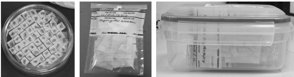
Fig 3. Ceparario en papel filtro. (a) Inóculo en placa, (b) Bolsa estéril con sobres de papel celofán conteniendo papel filtro con esporas, (c) Almacenamiento de bolsas en contenedor de plástico.

Preservación en papel filtro. El método utilizado fue una modificación del método desarrollado por Fong, Anuar, Lim, Tham y Sanderson (2000). Trozos de papel filtro Whatman No.1 de 1x1cm fueron envueltos en papel aluminio, esterilizados en una autoclave por 60 min a 121°C y posteriormente secados en horno a 100°C por 3 horas. Se colocaron cubriendo la superficie de placas con medio ADP. Micelio de 10 días de crecimiento fue transferido a los trozos de papel filtro por medio de aguja de disección. Cuando los cuadros de papel filtro en la placa fueron completamente cubiertos por micelio y esporas del hongo, se retiraron y separaron del medio PDA utilizando pinzas estériles. La mayoría de las especies de hongos tardaron más de 5 días para crecer sobre el papel filtro. El papel filtro con el micelio se colocó en placa estéril y llevada a la incubadora hasta su secado (20-25 días). Una vez que las transferencias en papel secaron, se colocaron de 3 a 4 piezas de papel filtro en sobres de papel celofán. Los sobres resultantes de cada especie se colocaron en bolsas de plástico estériles y rotuladas. Todas las bolsas se colocaron en un contenedor de plástico y se almacenaron a 10°C. Figura 3.