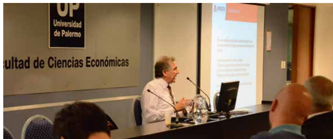
ACTIVIDAD UP | 5

En segundo lugar, y para cerrar el encuentro, se expresó en torno al contexto legal: "El marco actual es propenso para el desarrollo de pequeños y medianos emprendimientos. Produce un alivio fiscal y, sobre todo, incentiva a hacer inversiones productivas. Es decir, que ayuda a tener inversiones y a tratar de mejorar el desempeño de las pymes en el sector".