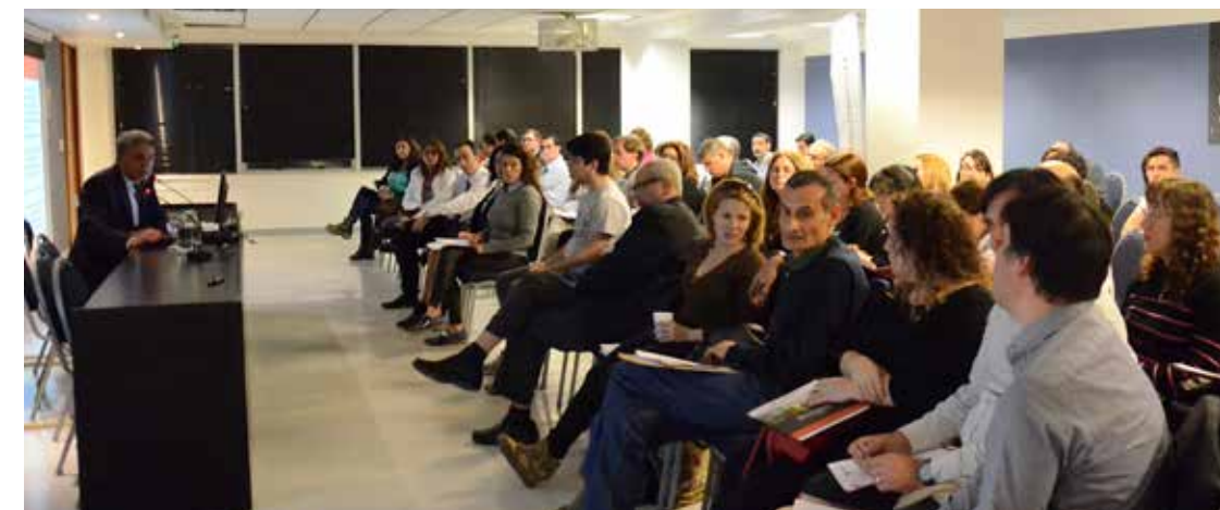
4 | ACTIVIDAD UP

Para finalizar, otorgó consejos a tener en cuenta cuando se trabaje con monotributistas: "El contador debe tener en cuenta que suelen ser muy oculadores, ya que no tienen la obligación de emitir comprobantes o llevar los registros. Después, aparecen ingresos que no conciden con lo declarado, entonces eso genera un problema para el contador porque generalmente los datos que se le informan son muy pobres. Se tiene que crear una conciencia tributaria para que se informen realmente todas las ganancias y eso ayudaría mucho al contador para trabajar correctamente".