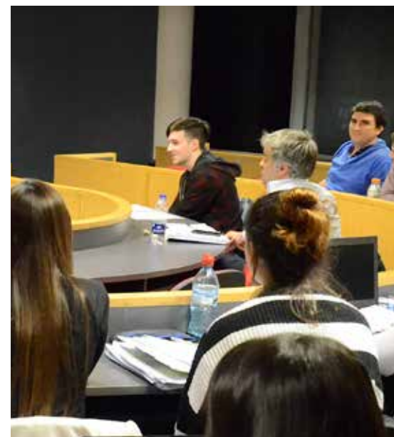
ACTIVIDAD UP | 3